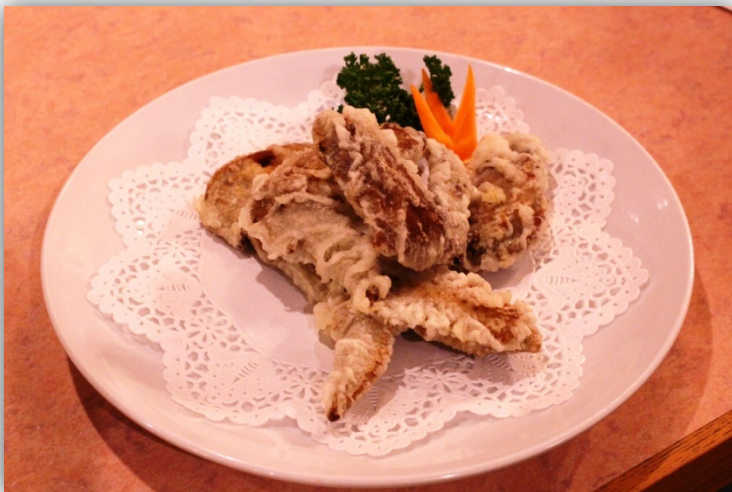
七味風味の手羽先あげ